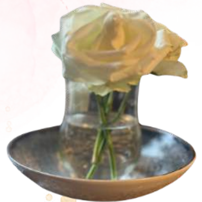
Schaal of kommetje