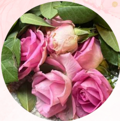
Bloemen naar keuze