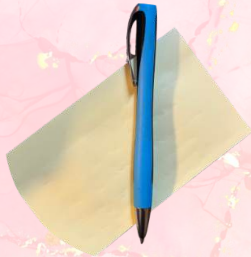
Pen en Papier